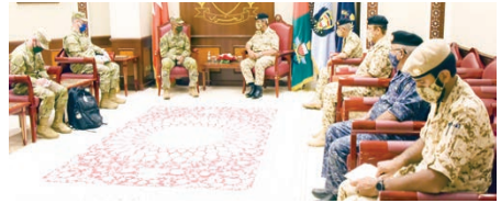
القائد العام خلال لقاء قائد القيادة المركزية الأمريكية.