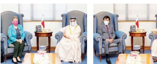
الشيخ خالد بن عبدالله خلال لقاء سفير اليابان.

أكد الشيخ خالد بن عبدالله آل خليفة نائب رئيس الوزراء، أن تنامي العلاقات البحرينية اليابانية يعكس ما وصلت إليه تلك العلاقات من مستوى متقدم، ويقتضيه الوقت نفسه اتفاقاً جديداً لتعاون بين البلدين الصديقين في العديب، من المجالات ذات الأهمية الاستراتيجية.