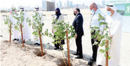
جانب من تمشيد الحملة الوطنية للتشجير.