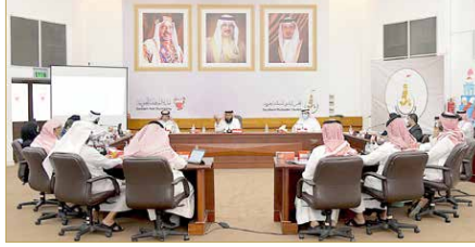
اجتماع بلدي الجنوبية

وأكد أن دور الوزارة رقابي، فحين ليس سلطة تنفيذية وليس مخولين بالإزالة، وإنما دور البلديات والجهات المختصة الإزالة.