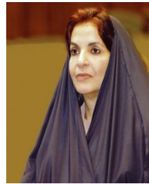
سمو الأميرة سبيكة بنت إبراهيم آل خليفة.