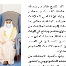
الشيخ خالد بن عبدالله خلال لقاء سفير اليابان.

أكد الشيخ خالد بن عبدالله آل خليفة نائب رئيس الوزراء، أن تنامي العلاقات البحرينية اليابانية يعكس ما وصلت إليه تلك العلاقات من مستوى متقدم، ويقتضيه الوقت نفسه اتفاقاً جديداً لتعاون بين البلدين الصديقين في العديب، من المجالات ذات الأهمية الاستراتيجية.