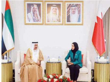
○ رئيسة مجلس النواب خلال لقاء رئيس المجلس الوطني الاتحادي الإماراتي.

وأشار إلى أن العلاقات البحرينية الإماراتية تمثل نموذجاً يحتذى به على مستوى دول المنطقة من تعاون وتكامل وتوافق وتنسيق متيز ومستمر، عبرها عن حرص المجلس الوطني الاتحادي الإماراتي على تعزيز التعاون البرلماني بين مجلس النواب في مملكة البحرين في مختلف المجالات، وسادة المملكة بشكل دائم كل القضايا الداخلية منها والخارجية.